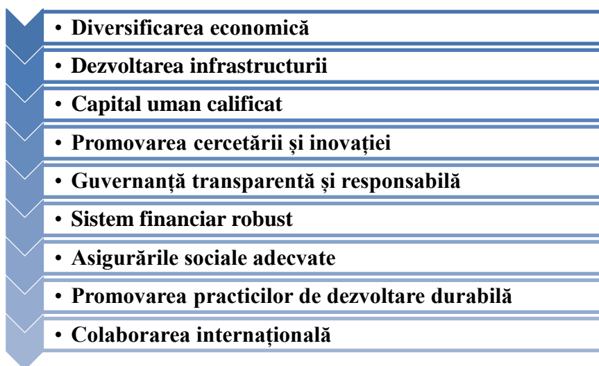
Figura 3. Bunele practici și strategii de dezvoltare a rezilienței economice

Sursa: elaborat în baza studiului efectuat