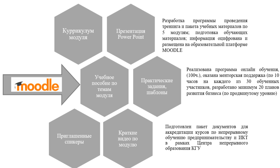
Рисунок 2. Компоненты образовательной программы